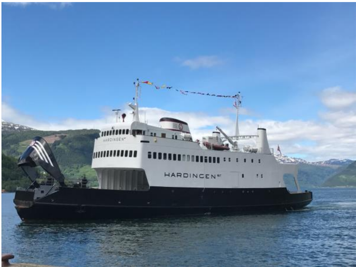
M/F Hardingen på sjarmørtur på gamle trakter – inn mot Kinsarvik.